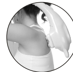
Massagem nas Costas