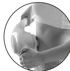
Massagem no abdômen