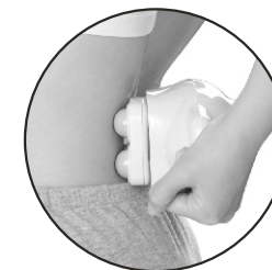
Massagem na Cintura