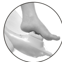
Massagem nos Pés