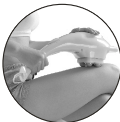
Massagem nas Pernas