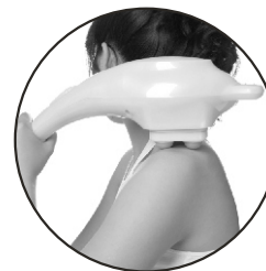
Massagem no Pescoço